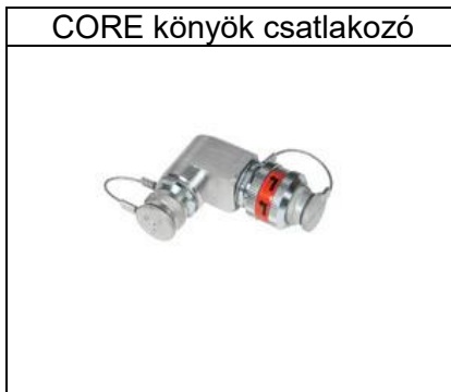
CORE könyök csatlakozó