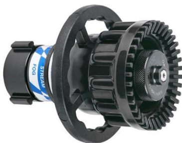
MasterStream MP-R1250S-BJ automata nyomásszabályzás, Vízáram 600-4500 l/perc