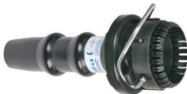
FoamJet FJ-LX-M nehézhab feltét