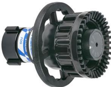
MasterStream MP-RS2500-BJ változtatható vízáram 2500 l/perc