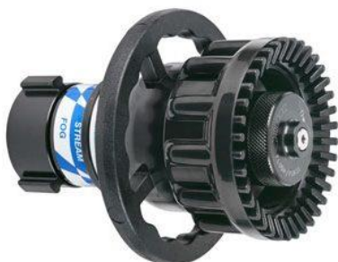
MasterStream MP-RF1000-BJ fix vízáram, 2000 l/perc