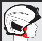
Párnázott, trapéz alakú állsúly