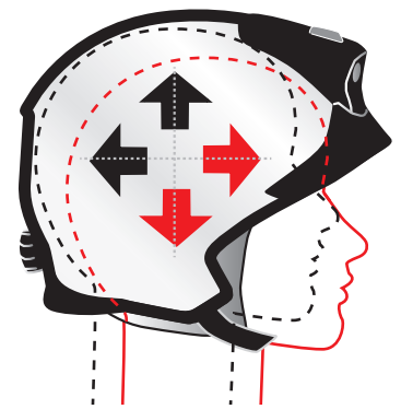
Egyszerű szabályozhatóság minden tengelyben.

Az optimalizált súlypont szintén a HEROS-titan egyedülálló újdonsága. A sisaksúly fej tengelyéhez viszonyított ergonomikus orientációjának köszönhetően a fej mindig egyensúlyban van. A súlypont és az arcvédő távolsága gyorsan és egyszerűen beállítható. A sisakbelső egyszerű beállítási lehetőségeinek köszönhetően a HEROS-titan mindig tökéletes egyensúlyban van.