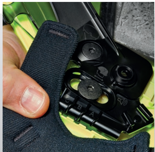
5. A sisakhéj sisakbelsőhöz viszonyított eltolásával a sisakot optimálisan a test súlypontjának a tengelyéhez lehet igazítani.