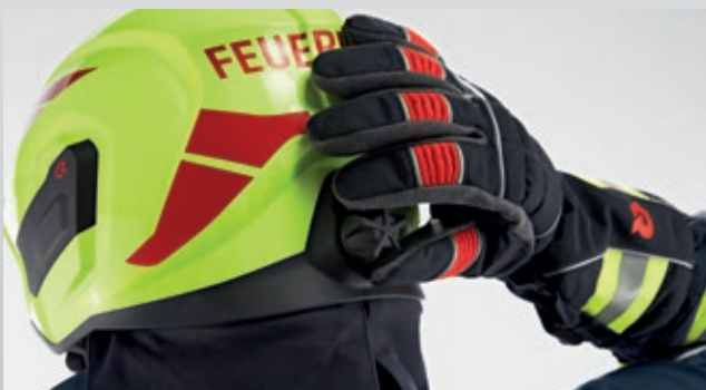
4. A kívül található forgatógomb segítségével a szorítást bármikor hozzá lehet igazítani a viselési érzethez – még tűzoltókesztyűben is egész egyszerűen.