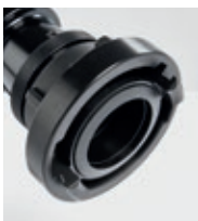
Storz B vagy C