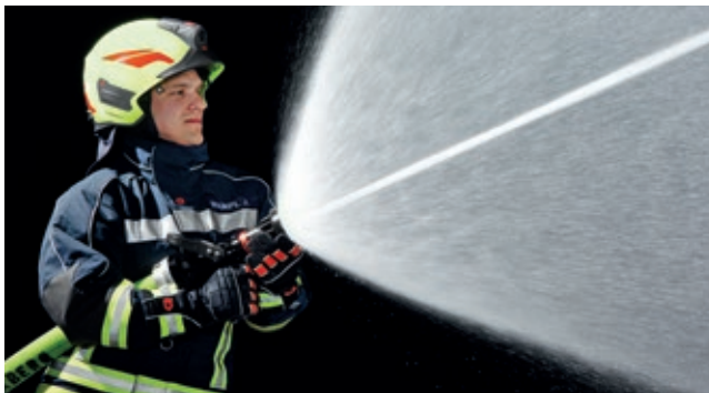
Kombinált kötött és szórt sugár

A kombinált kötött és szórt sugár nem a PRO JET egyetlen kiemelkedő tulajdonsága. Lényeges előnye abban áll, hogy a sugárcső alkalmas a CAFS-szel történő használatra. A gépjármű CAFS berendezéséből vagy a mobil PolyTrolley-ből kapott nagy nyomású hab segítségével rendkívül hatékonyan és gyorsan lehet tüzet oltani.